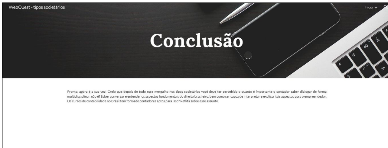
Figura 6 – Tela de conclusão da WebQuest

A tela de conclusão buscou realizar condensar aquilo que o estudante aprendeu sobre o conteúdo, bem como deixá-lo refletindo sobre aspectos adicionais que poderiam ser investigados, tal como apresentado na figura 6.