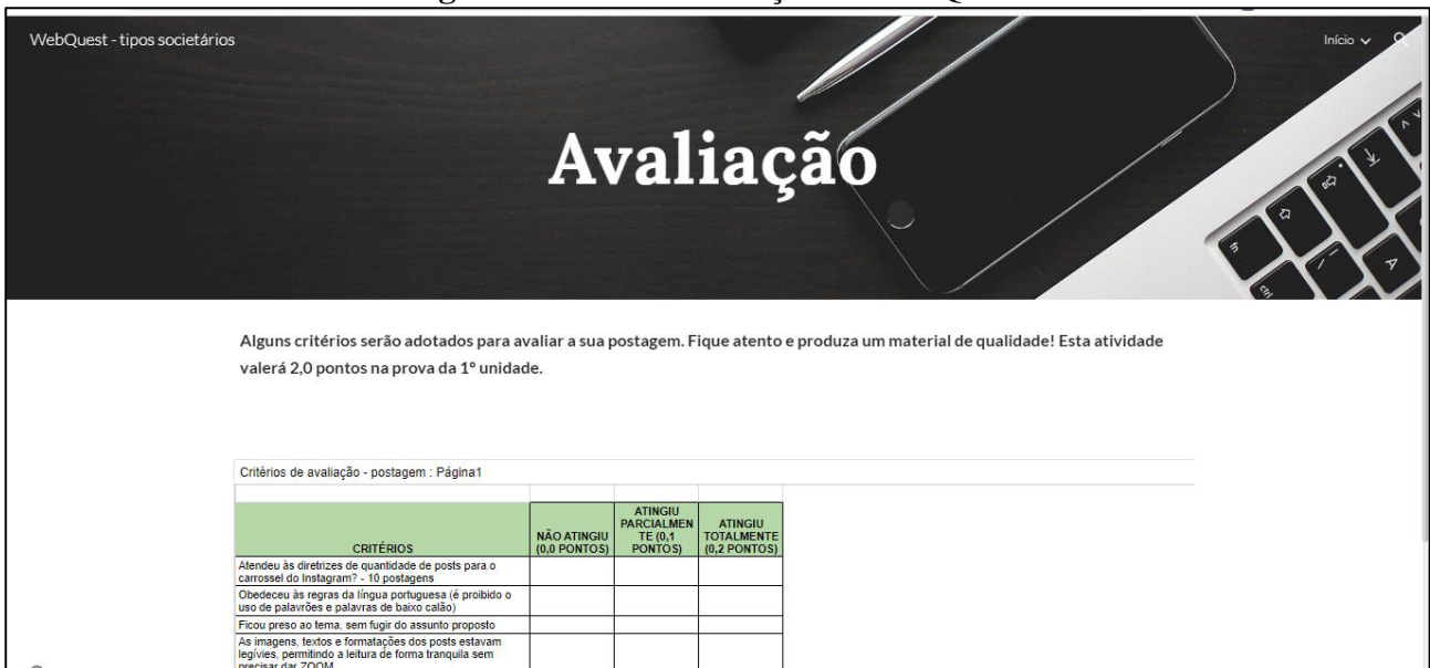
Figura 5 – Tela de avaliação da WebQuest

A WebQuest ainda contou com a seção de “avaliação” onde eram apresentados os critérios verificados na postagem criada, bem como a pontuação específica para cada ponto de averiguação. A figura 5 apresenta a tela apresentada aos discentes.