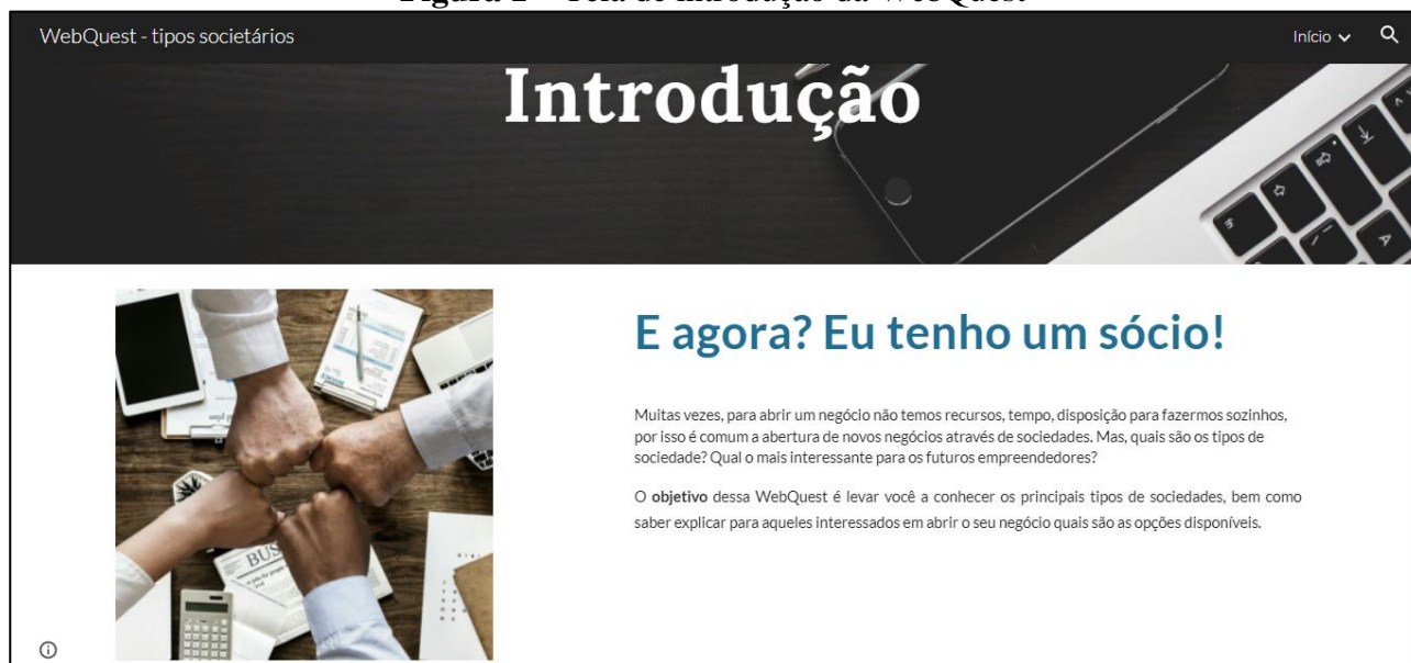
Figura 1 – Tela de introdução da WebQuest

Na figura 1 apresenta-se a tela de introdução da WebQuest a qual traz a ideia de abrir uma empresa em sociedade, sendo que o primeiro desafio a ser enfrentado é a escolha do tipo empresarial em que a instituição será cadastrada.