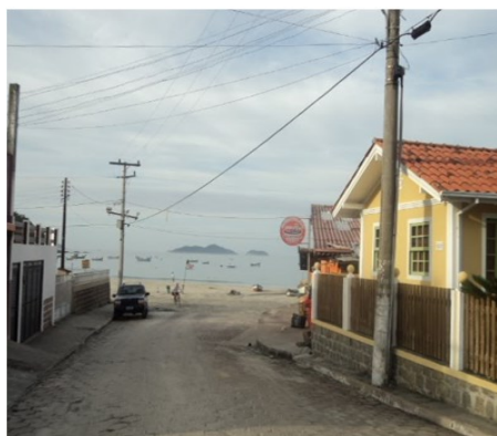
Figura: Vista da Rua da Escola na comunidade do Pântano do Sul, maio de 2012.

No ano anterior ao meu ingresso no PIBID na Escola Dilma Lúcia, lecionei na escola de ensino fundamental Severo Honorato da Costa, que está situada no bairro ao lado da Armação do Pântano do Sul, a comunidade do Pântano do Sul. Na rua da escola “do Pântano” existem importantes ocorrências arqueológicas no costão rochoso, como oficinas líticas e inscrições rupestres. Enquanto lá lecionava, realizamos uma saída de estudos com a turma do 6º ano a fim de conhecer as inscrições rupestres e as oficinas líticas da Praia. Assim, buscamos identificar com os alunos esses locais e como patrimônio arqueológico, abordado enquanto os primeiros registros históricos ocupação humana da região. Posteriormente, realizamos relatórios de campo sobre a importância desses sítios para a história local e a necessidade de sua preservação.