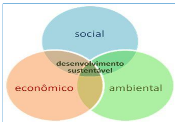
Figura 1 – Dimensões da Sustentabilidade

A sustentabilidade é composta de três dimensões: econômica, ambiental e social. Essas dimensões são também conhecidas como triple botton line , conforme a figura a seguir. Estas deixam claro a necessidade de tornar compatível a melhoria nos níveis e na qualidade de vida com a preservação e conservação ambiental.