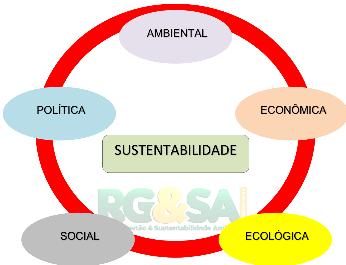
Figura 2: Esquema dos tipos de sustentabilidade.

A sustentabilidade atualmente vem ganhando espaço e visibilidade quando se trata de fontes energéticas e recursos naturais, ou seja, ao que está relacionado às relações entre sujeito e o meio ambiente, principalmente quando se trata nos problemas de deterioração da relação entre a ecologia de um modo geral com o desenvolvimento econômico (FEIL, 2017).