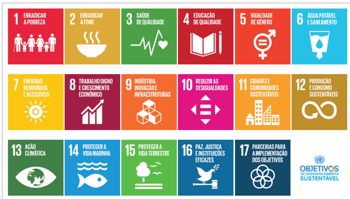
Figura 1: 17 Objetivos do Desenvolvimento Sustentável para transformar o nosso mundo.

Esses objetivos tratam-se da Agenda 2030, fruto do trabalho em conjunto de governos e cidadãos de todo o mundo, com intuito de construir um modelo global para acabar com a pobreza, promover a prosperidade e o bem-estar, bem como proteger o meio ambiente e combater as alterações climáticas (UNRIC, 2019).