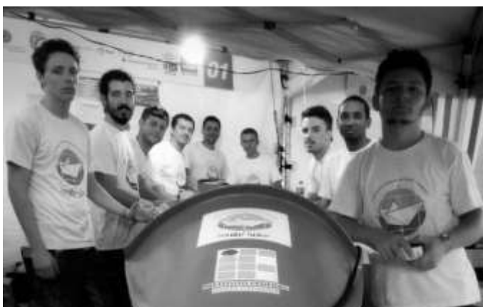
Figura 4. Equipe no box em 2014 (Búzios - RJ).

Consumo de energia, composto por circuitos auxiliares responsáveis pela segurança e comunicação da embarcação, pelo motor e por consequência todo sistema mecânico acoplado ao eixo do motor, responsável pela propulsão da embarcação.