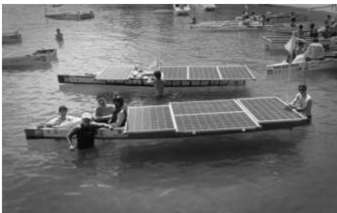
Figura 5. Barco durante uma prova da competição DSB 2014 (Búzios - RJ).