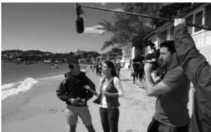
Figura 3 - Divulgação do uso de energias limpas pela Rede Globo durante do DSB 2013