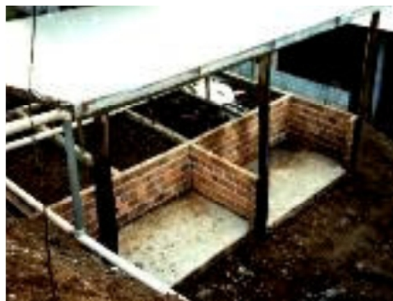
FIGURA 5 - TIPO DE COBERTURA DAS CÂMARAS DE INCORPORAÇÃO E COMPOSTAGEM.

www.cnpsa.embrapa.br/pnma/pdf_doc/doc_pnma.pdf