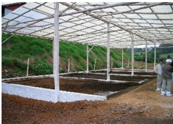
FIGURA 6 - CÂMARAS DE INCORPORAÇÃO DE DEJETOS EM LEITO DE MARAVALHA.

A operação de raspagem dos dejetos nas baias, ao invés da limpeza com água, contribui significativamente para reduzir o volume de dejetos produzido. Na Figura 7, pode se observar o trabalho de manejo e revolvimento do substrato, com o uso de um trator agrícola composto.