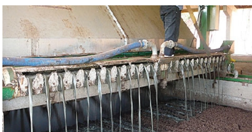
FIGURA 2 - VISTA DO SISTEMA DE TRATAMENTO DOS DEJETOS DE SUÍNOS EM PLATAFORMA DE COMPOSTAGEM, REVOLVIMENTO COM O USO DE TRATOR E REVOLVIMENTO MECÂNICO