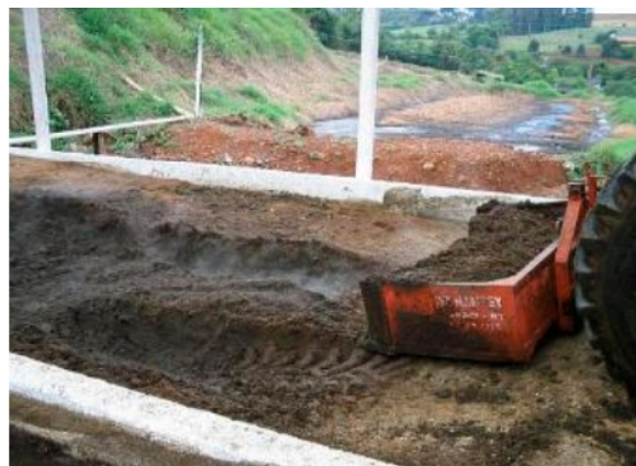
FIGURA 7 - MANEJO DO COMPOSTO COM O USO DE PÁ CARREGADEIRA ACOPLADO AO TRATOR.