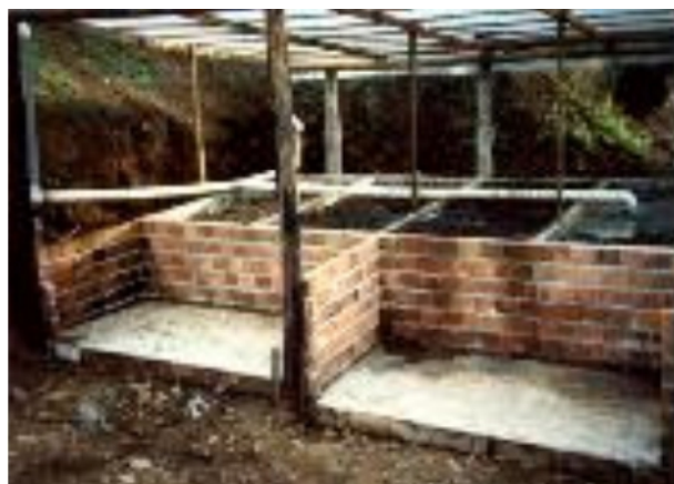
FIGURA 4 - LOCALIZAÇÃO DAS CÂMARAS INCORPORAÇÃO E COMPOSTAGEM DE DEJETOS.

A seguir apresenta-se uma sequência de fotos (Figuras 4 e 5) de um sistema de tratamento de dejetos de um pequeno sistema de produção de suínos. Nas figuras observa-se o local de construção, os tanques de incorporação e compostagem (Figura 4, quatro tanques primários e dois secundários), o tipo de cobertura da instalação (Figura 4), a condução dos dejetos através de tubulações de PVC até os tanques e a passagem dos dejetos para os tanques secundários (Figuras 4 e 5).