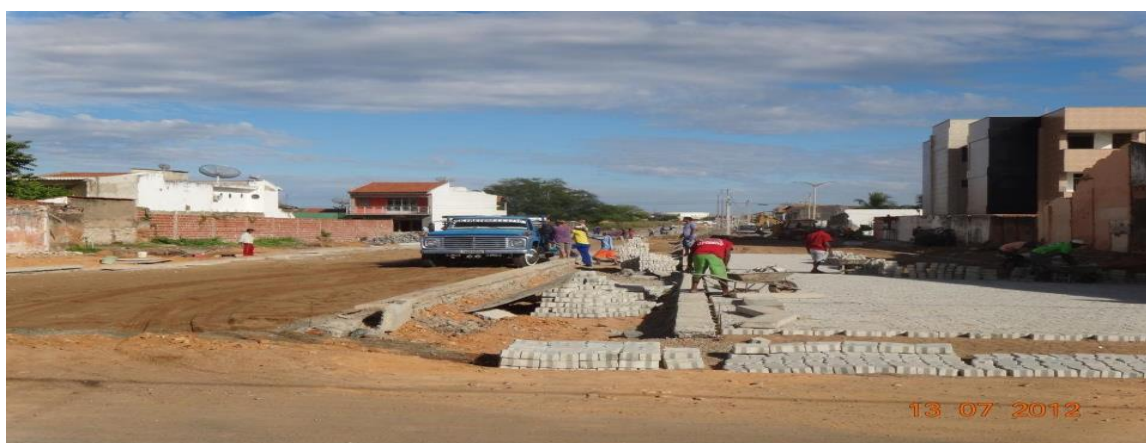
Figura 1. Degradação ambiental detectados na lagoa da Bastiana.