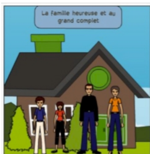
Figure 2 - Famille adoptive du sujet 4

Nous avons choisi de mettre en évidence ensuite des éléments concernant le rapport des sujets à leur identité personnelle. Ainsi, la façon dont les sujets se sont