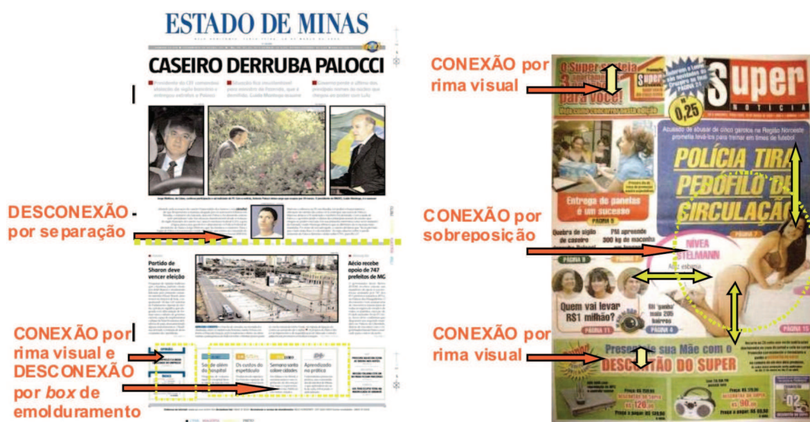
Figura 5 – Primeira página dos jornais Estado de Minas e Super Notícia – análise sob o enfoque dos recursos de emoldramento.

Já no Super , há uma conexão entre os elementos, os quais não compõem necessariamente uma unidade de informação, mas sim um “mix” de variedades apresentadas ao leitor. Nesse sentido, vale assinalar o efeito de conexão configurado pela representação de Nívea Stelmann, em que parte de sua cabeça “invade” o domínio da chamada “Polícia tira pedófilo de circulação”. A imagem da atriz parece concentrar a atenção do leitor em um primeiro momento para, em seguida, distribuí-la para as chamadas com as quais estabelece conexão, conforme sublinhado na análise dos recursos de saliência.