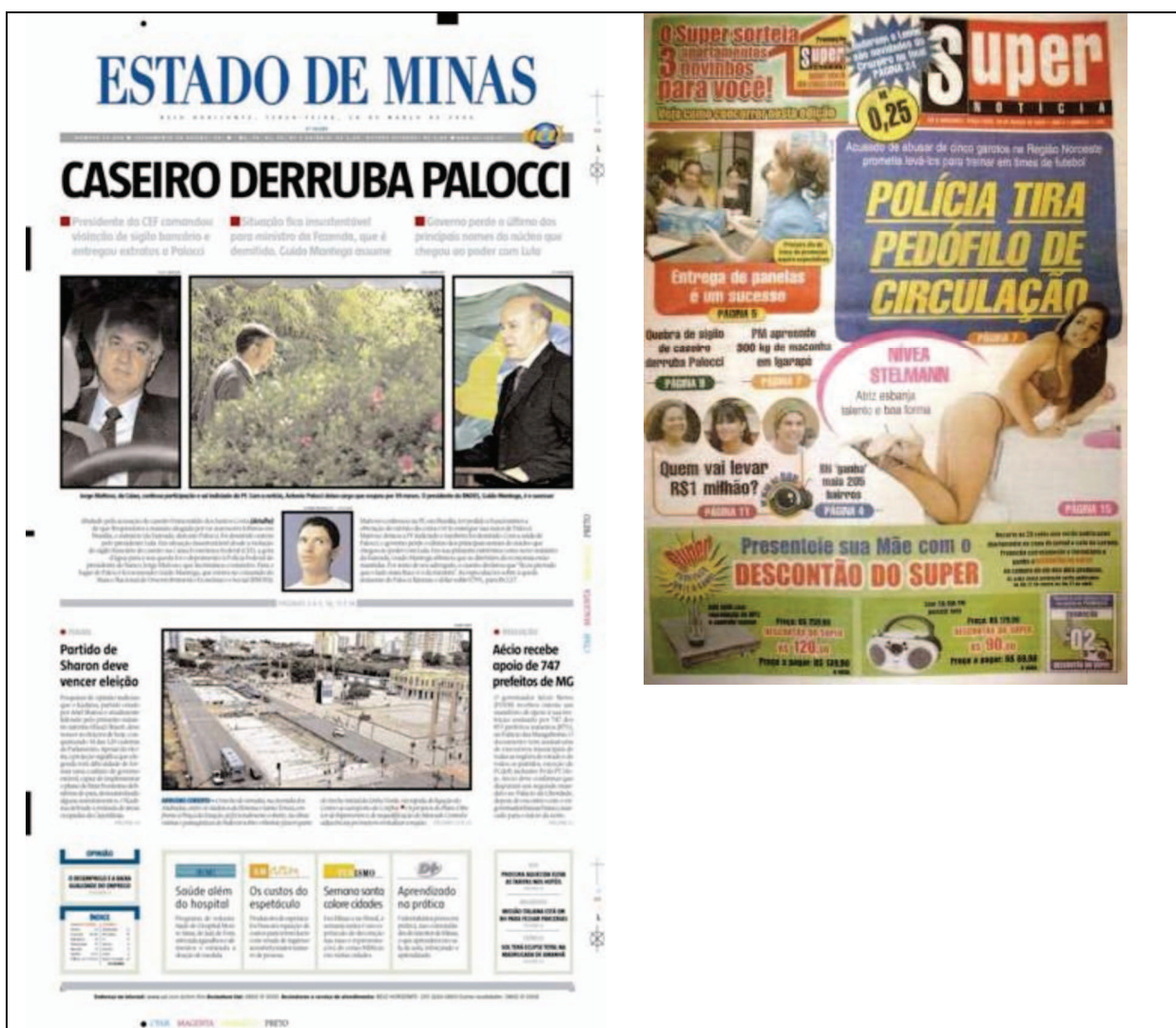
Figura 2 – Primeira página das edições de 28/03/06 dos jornais Estado de Minas e Super Notícia.

Selecionado aleatoriamente para fins de estudo-piloto, o corpus é composto pela primeira página de dois jornais mineiros: Estado de Minas (formato padrão) e Super Notícia (formato tabloide), edições de 28 de março de 2006, a fim de verificar as tendências destes jornais no que tange à construção de significados sociais em suas respectivas primeiras páginas.