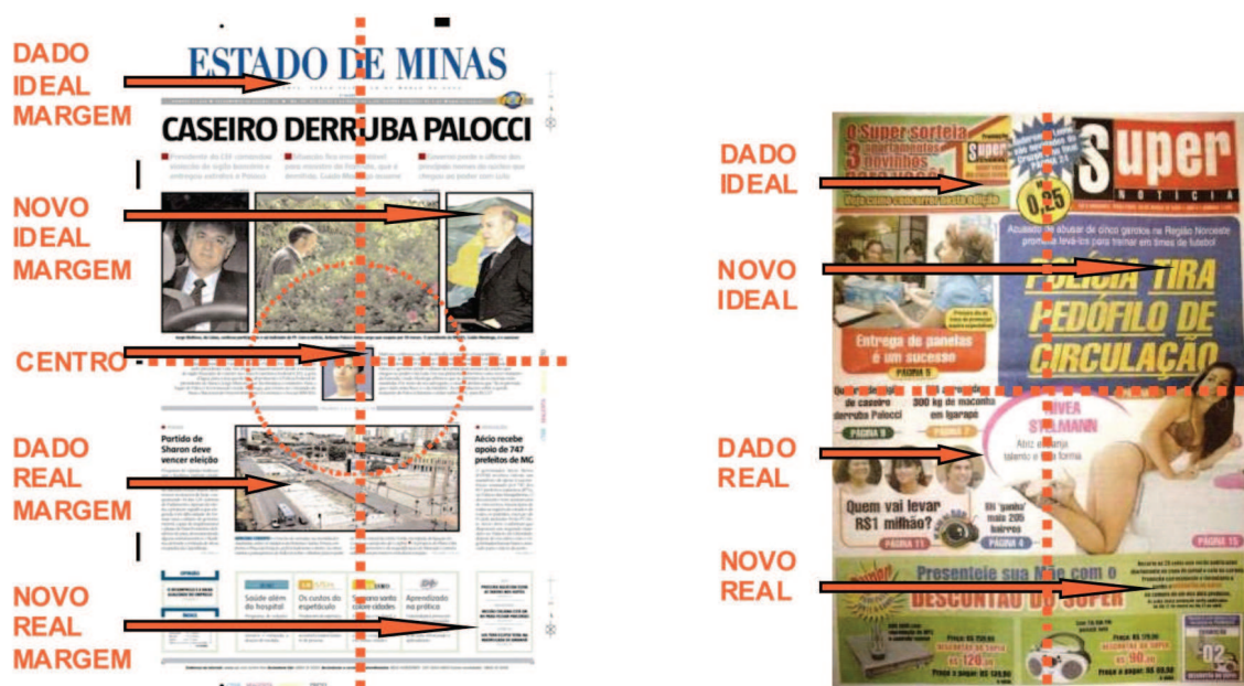
Figura 3 – Primeira página dos jornais Estado de Minas e Super Notícia – análise sob o enfoque do valor informacional.

No campo do Real, seção inferior da página, predominam pequenos textos de diferentes editorias (cultura, saúde, voluntariado, economia, ciência), excetuando-se a notícia sobre a cobertura do rio Arrudas, cuja representação aparece em posição central e em tamanho considerável. A obra faz parte do projeto Linha Verde, via expressa a ser construída pelo Executivo estadual, ligando o centro de Belo Horizonte ao Aeroporto Internacional de Confins. O “Boulevard Arrudas”, atuando como um dos braços deste projeto, visa promover a revitalização urbanística do centro da cidade, chamando, portanto, a atenção do leitor para as ações políticas de caráter local. Talvez a ênfase atribuída ao “Boulevard Arrudas” possa ser explicada pelo contexto histórico, visto que sua inauguração foi feita às vésperas da 47ª Reunião Mundial do BID, que trouxe para a cidade cerca de 7 mil banqueiros, investidores e administradores públicos.