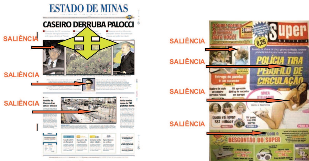
Figura 4 – Primeira página dos jornais Estado de Minas e Super Notícia – análise sob o enfoque dos recursos de saliência.