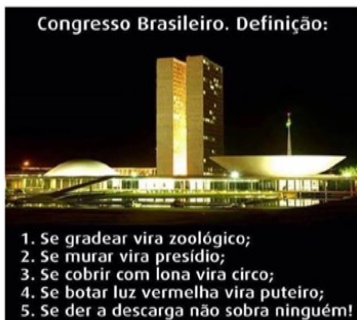
Figura 4 – Meme Parlamento brasileiro

duas metanálises anteriores também se aplica aqui. Considerando a multidimensionalidade do meme, não é possível afirmar, com base em um dado objetivo (sem uma decisão prévia do analista), qual a expressão que introduz e qual recategoriza o referente, assim como não se pode determinar a ordem do movimento introdução-recategorização. Considerando que os referentes “zoológico”, “presídio”, “circo”, “puteiro”, “vaso sanitário” estão numerados, se pode argumentar que há um indício de que “presídio” (número 2) recategoriza “zoológico” (número 1), por exemplo, mas, ainda assim, não há dado para se afirmar que “zoológico” recategoriza “congresso nacional”. Considerar isso é usar a lógica linear da linguagem verbal, que não é a lógica da imagem, também não é a lógica do verbo-imagético.