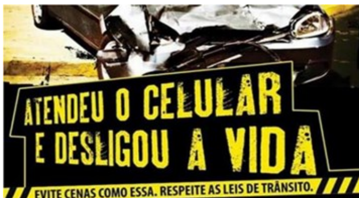
Figura 6 – Cartaz de campanha socioeducativa sobre trânsito

Por fim, chegamos à dissertação de Santana (2019), da qual extraímos a análise de um anúncio de campanha socioeducativa (Figura 6) cujo tema é o encapsulamento verbo-imagético.