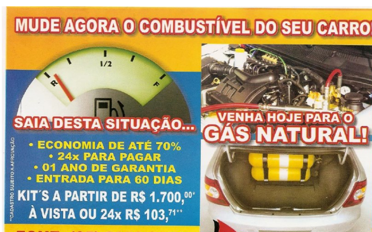
Figura 1 – Panfleto com propaganda de serviço automotivo

A análise de Cavalcante e Custódio Filho (2010) se insere em um trabalho teórico de revisão do conceito de texto, tendo em vista a inserção do elemento não verbal (notadamente o elemento de natureza visual). No contexto desta discussão, a autora e o autor empreendem a análise de um panfleto (Figura 1), considerado como um exemplar de texto multimodal.