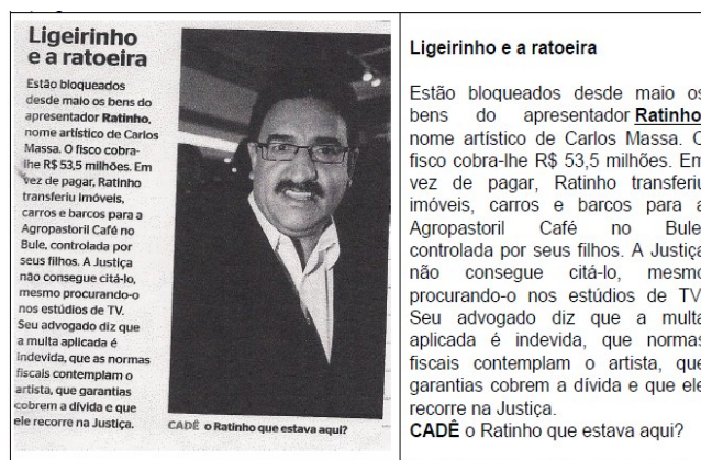
(Nota jornalística, Revista Época, 08 de outubro de 2012, pág. 37)

O mesmo raciocínio se aplica à análise da segunda nota (Figura 3). A introdução referencial é uma opção do leitor: se o leitor reconhece, primeiramente, a expressão referencial “Ligeirinho”, o referente é introduzido aí. Caso contrário, o referente é introduzido pela imagem (foto).