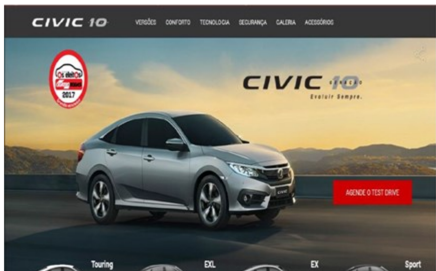
Figura 5 – Anúncio publicitário Honda CIVIC