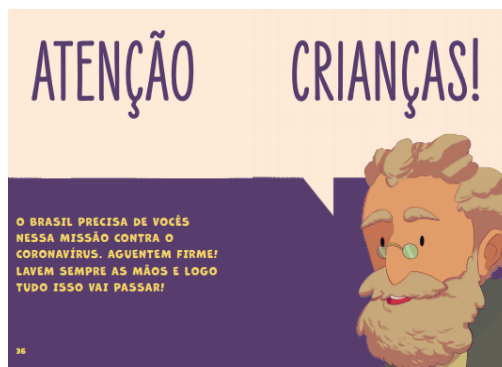
Figura 9 – Imagem da “convocatória” do avô (BRASIL, 2020, p. 36)