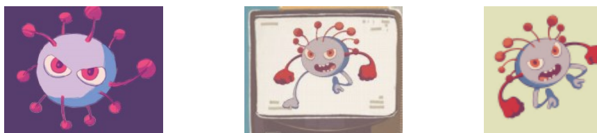
Figura 3 – Imagens representativas do Coronavírus (Brasil, 2020, p. capa; p. 7; p. 18)

Em oposição às personagens humanas, que convivem harmonicamente, está concretizada a personagem coronavírus: