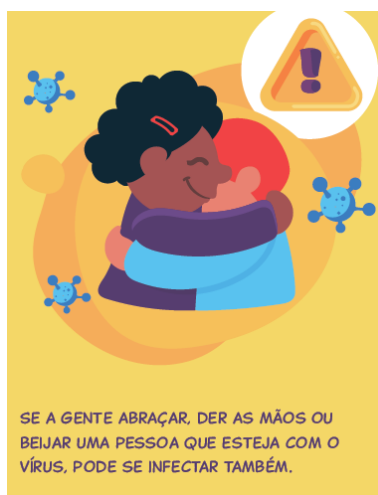
Figura 8 – Imagem para tratar da transmissão do vírus (Brasil, 2020, p. 19)

À página 19, a Cartilha informa verbalmente, do lado esquerdo, as formas de disseminação e de transmissão do vírus pelo ar, pelo espirro e pela tosse. A imagem de um abraço entre duas pessoas, com o coronavírus em torno, é disposta para a constituição do discurso de distanciamento físico para prevenção à transmissão.