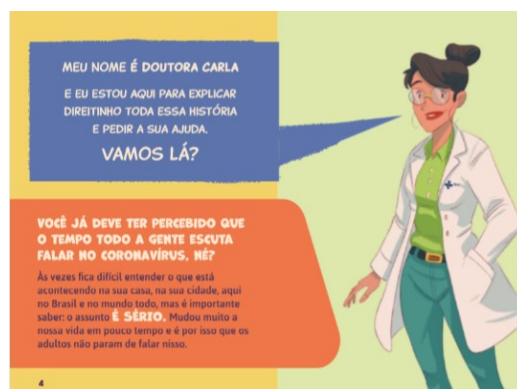
Figura 7 – Imagem da apresentação da médica (Brasil, 2020, p. 4)