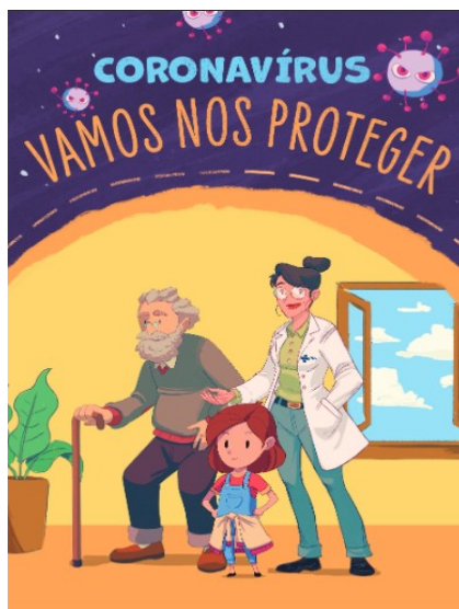
Figura 2 – Capa da Cartilha

A tematização discursiva do enfrentamento da pandemia de Covid-19 pela informação e prevenção, que desfecha na reconfiguração de hábitos de adultos e crianças no isolamento social recomendado, constitui o discurso aparente que orienta socialmente a produção da Cartilha (Figura 2), do Ministério da Saúde, como elo enunciativo refratário do acontecimento maior que perpassa a realidade social: o cronotopo da pandemia da Covid-19.