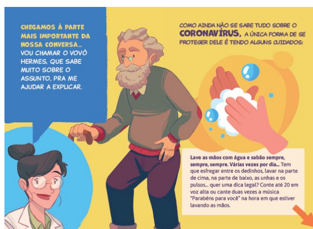
Figura 5 – Papel social da pessoa idosa (p. 22-23)

Na Figura 5, a relação de proximidade entre as personagens é confirmada. Porém, no momento de tecer orientações científico-objetivas sobre formas de prevenção da doença, a voz da médica não é acionada de forma direta. Esse papel é posto à incumbência do avô, cuja voz é validada pela médica, como se analisa: