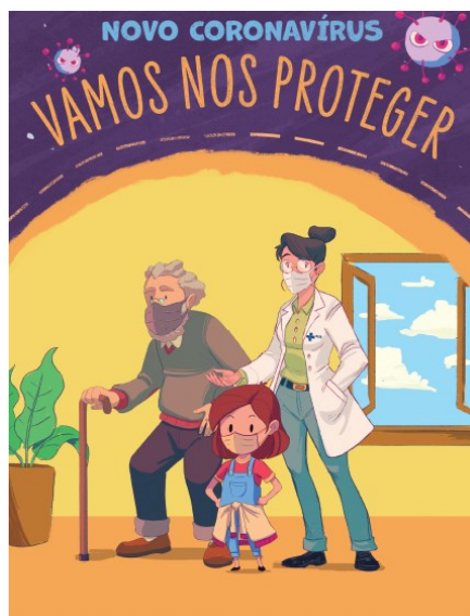
Figura 10 – Capa da Cartilha (versão 2022).

Fonte: Disponível em: https://www.saude.gov.br/images/pdf/2020/April/06/Cartilha--Crian--as-Coronavirus.pdf . Acesso em: 26 set. 2023.