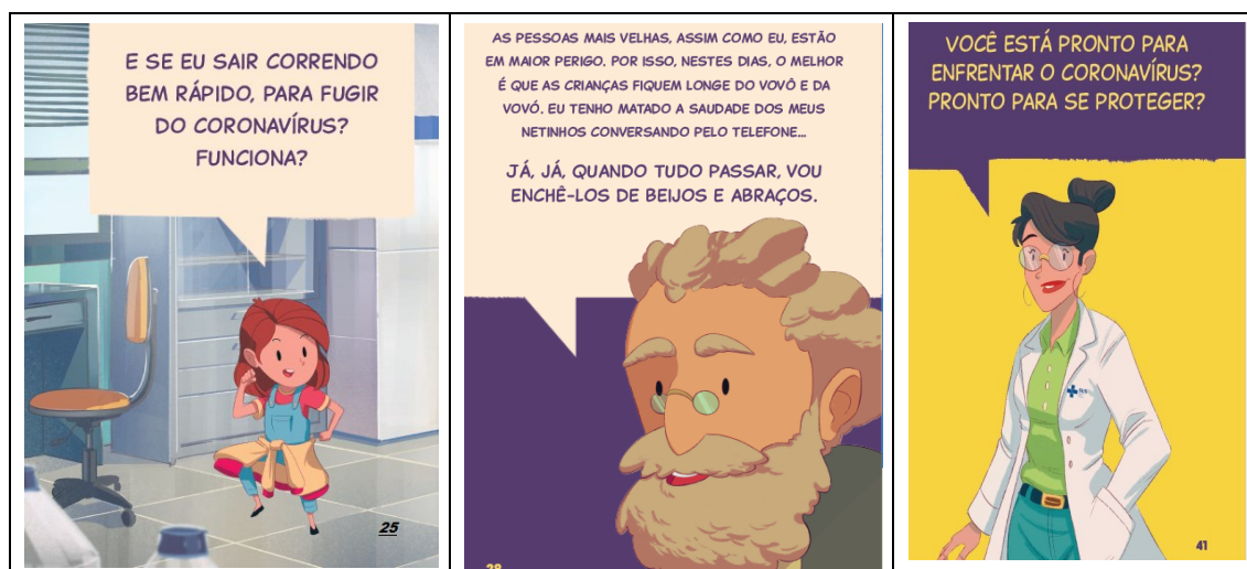
Figura 4 – Imagens das vozes representativas da Cartilha (p. 25; 28; 41)

Em outros excertos da cartilha, a interação autor-leitor é mediada pela interpelação avaliativa, com indicadores modais: “é importante”, “devem mostrar”, e por verbos no imperativo: “cantem, dancem, façam atividades [...]”. Essa mensagem parece apresentar a verdade a que o leitor/os pais devem aderir, no cuidado com os filhos. O mesmo movimento é constatado quando a Cartilha destaca os cuidados a serem tomados pelas crianças: “Lave as mãos com água e sabão sempre, sempre, sempre [...]; não use as mãos para cobrir a boca” (Brasil, 2020, p. 23-24). Aqui estão alguns valores que podem ser atribuídos como efeitos expressivos próprios ao gênero discursivo “Cartilha”, cujo intuito é informar, ensinar, o que reverbera em seu estilo de linguagem, ao mesmo tempo que se orienta para a realidade na busca dos atos de engajamento do leitor. Por isso, Medviédev (2019[1928]) defende que os gêneros do discurso expressam de maneira própria e única uma realidade, constituindo-se em forma de agir social.