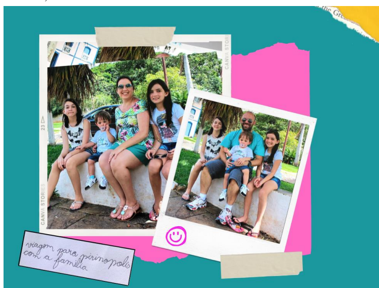
Figura 6 – Álbum de família criado por criança alfabetizada