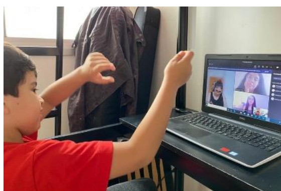
Figura 2 – Alfabetizando acompanhando aula remotamente

Para realizar o trabalho prático de ensino de Língua Portuguesa a partir da sequência didática proposta pela professora, os acadêmicos foram convidados a acompanhar uma criança entre 5 e 9 anos de idade, em processo de alfabetização, com quem tivessem contato (irmão, sobrinho, vizinho, filho, afilhado etc.). Como nem todos os acadêmicos tinham contato direto com a criança da idade solicitada, foram formados grupos com pelo menos um acadêmico que poderia acompanhar presencialmente uma criança. Os encontros realizados entre os grupos e o alfabetizando foram todos virtuais, via plataforma Teams, disponibilizada pela Universidade, ou outra semelhante (Google Meet, Zoom etc.).