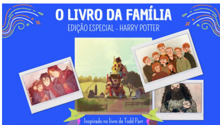
Figura 5 – Livro criado por acadêmicos