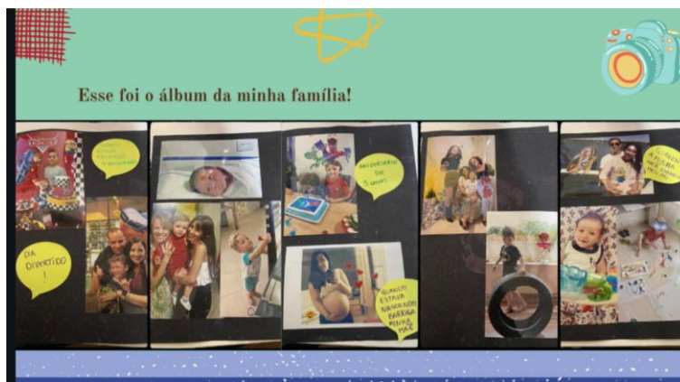
Figura 4 – Álbum de família com legendas escritas com a ajuda da professora