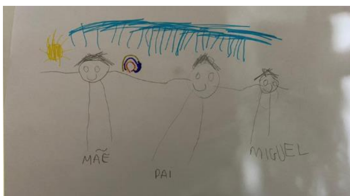
Figura 3 – Desenho da família com legenda da professora como escriba

Uma grande riqueza dessa sequência didática está no fato de que mesmo os alfabetizando que ainda não sabem ler e escrever podem elaborar o gênero textual legenda em álbum de família, como evidencia a Figura 3, que apresenta o desenho de uma criança de 5 anos, ainda não alfabetizada. A criança desenhou sua família, seu pai, sua mãe e ele mesmo. No momento em que a sequência didática foi desenvolvida, o alfabetizando só sabia escrever o próprio nome, então ele escreveu o nome embaixo da figura que o representava, e a alfabetizadora exerceu o papel de escriba e escreveu “pai” e “mãe”, embaixo das imagens indicadas pelo aluno.