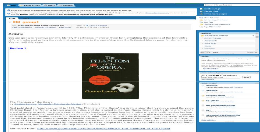
Figura 1 – Atividade de identificação de movimentos retóricos de resenhas

O módulo 1 incluiu a apreensão do gênero resenha e deu-se por meio de duas atividades realizadas na wiki . Segue a figura 1 com uma das atividades.