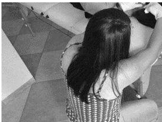
Figura 1 - Duas alunas praticando a sangria da orelha durante a Formação em Auriculoterapia ministrada pelo autor.

Em uma recente Formação em Auriculoterapia ministrada pelo autor, o procedimento de sangria foi ensinado utilizando-se lancetas da marca Accu-Chek® modelo Safe-T-Pro Uno , que permitem uma profundidade de penetração de 1,5 mm. Houve uma surpresa geral dos acadêmicos do curso com o fato de o procedimento ser indolor. Embora o ponto Er-jian seja o principal ponto de realização de sangria na orelha, outros pontos também foram utilizados com o mesmo sucesso, e sem desconforto. A citada formação teve a participação de 17 alunos.