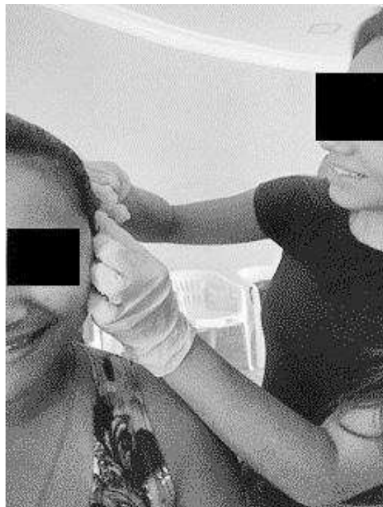
Figura 2 - Duas alunas praticando a sangria da orelha durante a Formação em Auriculoterapia ministrada pelo autor.